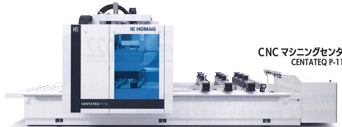
CNC マシニングセンター CENTATEQ P-110

〒578-0981 大阪府東大阪市島之内2-4-15 TEL:072-960-3560 / FAX:072-960-3561 URL: www.homag.com