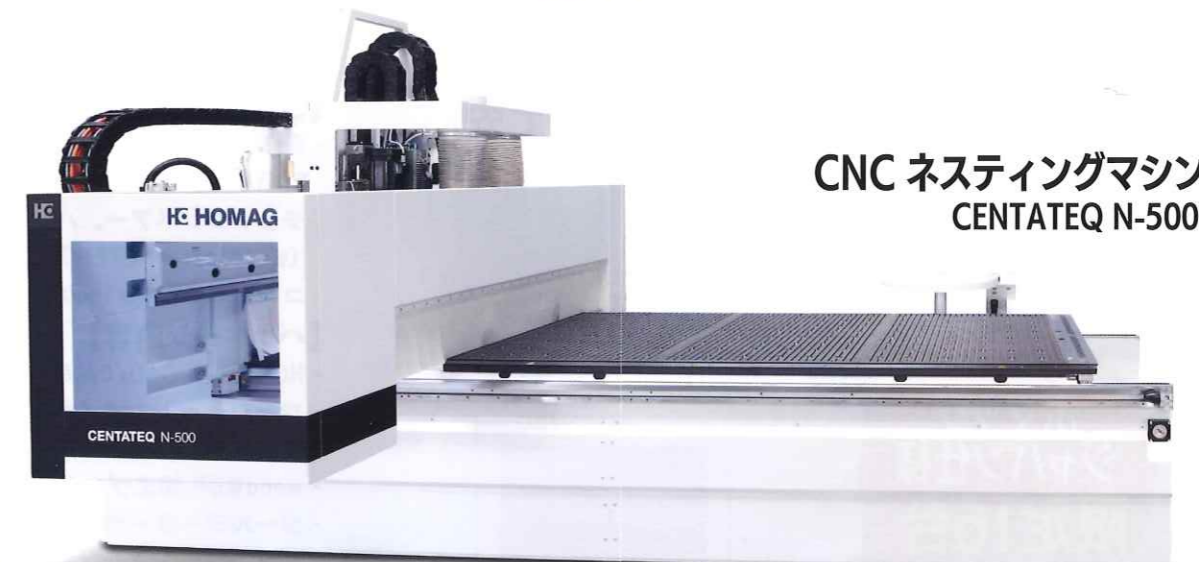
CNC ネスティングマシン CENTATEQ N-500